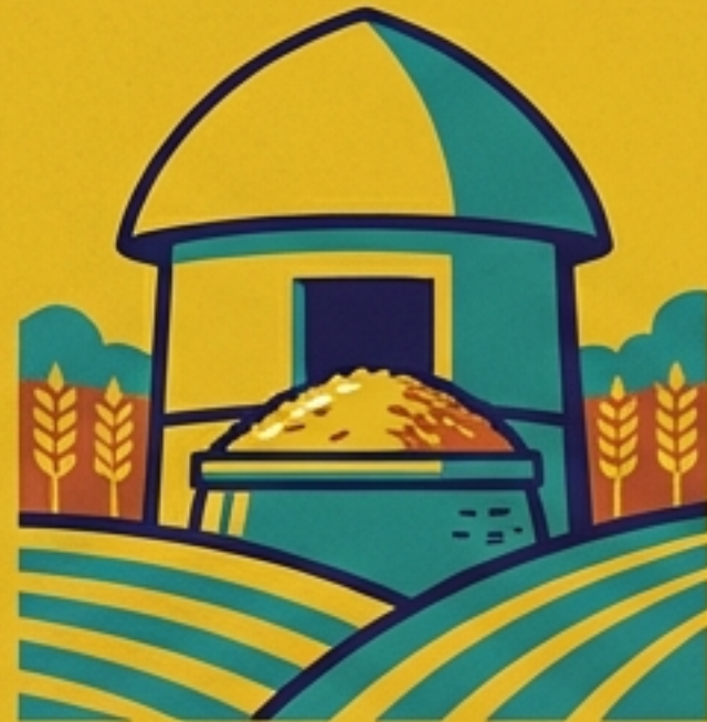
การถนอมอาหาร