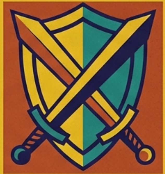
การเมือง

เมื่อมนุษย์เริ่มกักตุน ‘ส่วนเกิน’ ความขัดแย้งจึงเกิดขึ้น การเมืองและกฎหมายเกิดขึ้นเพื่อจัดการกับปัญหาการแย่งชิงส่วนเกินนี้