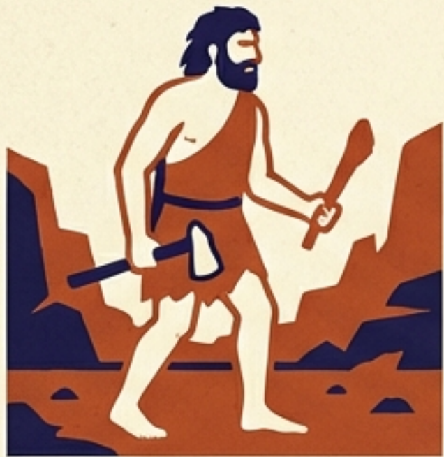
มนุษย์ยุคหิน