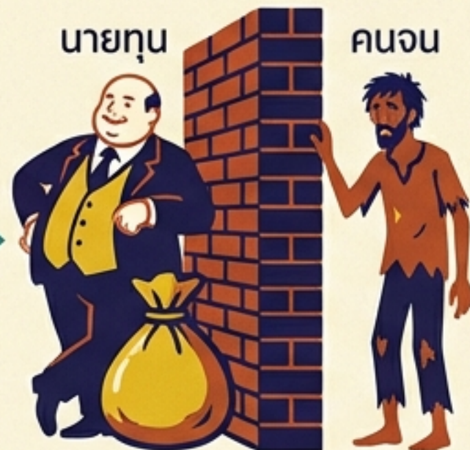
นายทุน vs คนจน